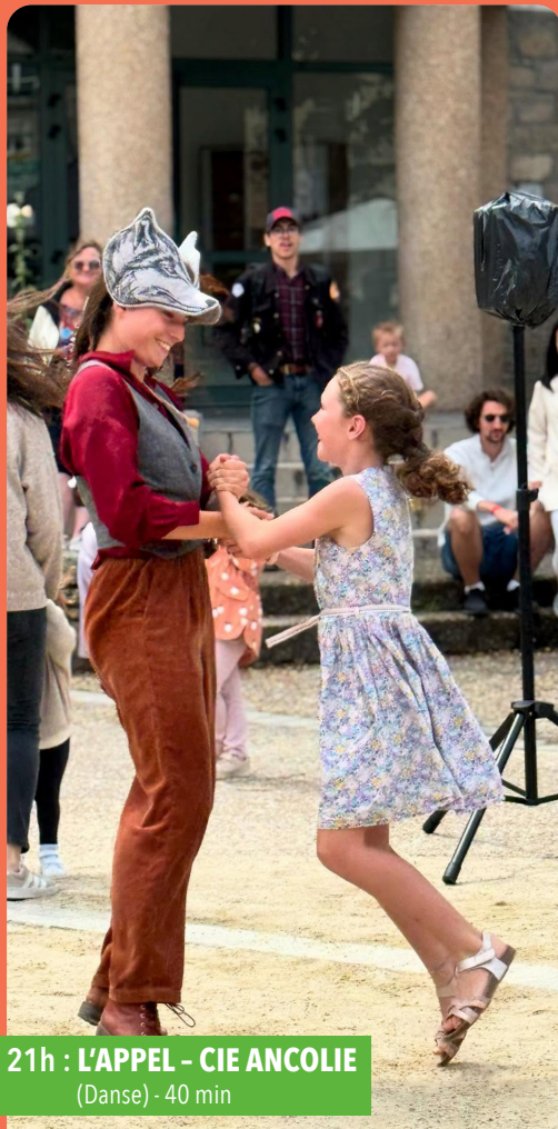
21h : L'APPEL - CIE ANCOLIE (Danse) - 40 min

Fanfare bordelaise née de l'union du dieu Magret et de la déesse Disco, mordez le gras de nos cuivres.