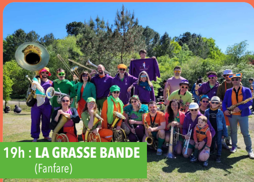
19h : LA GRASSE BANDE (Fanfare)

Fanfare bordelaise née de l'union du dieu Magret et de la déesse Disco, mordez le gras de nos cuivres.