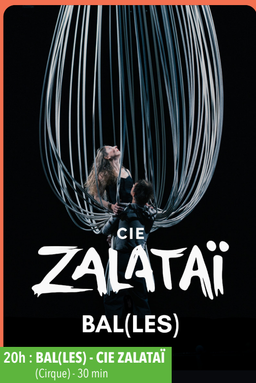
20h : BAL(LES) - CIE ZALATAÏ (Cirque) - 30 min

Effacer les limites et les horizons tangibles, s'engouffrer dans le cercle, renouer avec le folklore de nos fêtes et de nos imaginaires. Il est temps, de déployer nos ailes, de voler au-dessus des eaux, de répondre à l'appel.